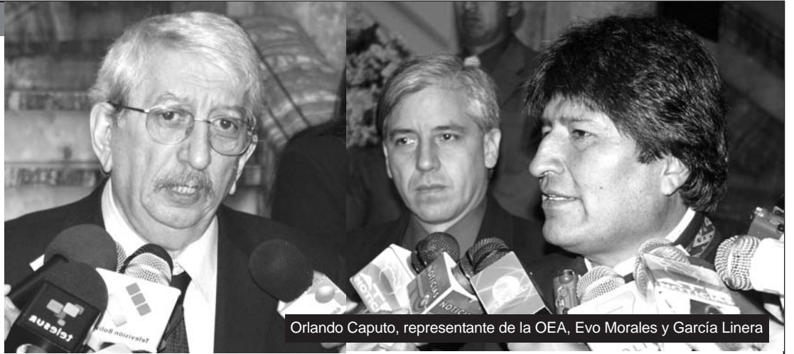
Orlando Caputo, representante de la OEA, Evo Morales y García Linera

“Soy consciente de las dificultades, de los niveles de desacuerdo que se han planteado en Bolivia, pero también soy consciente de la necesidad de resolverlo (...) las tensiones deben resolverse por vía pacífica”. Con estas palabras, Dante Caputo, Secretario de Asuntos Políticos de la OEA, experimentado en desactivar crisis políticas y procesos revolucionarios como los de Centroamérica en los 80, desembarca en Bolivia para discutir con gobierno y oposición y encausar un nuevo diálogo, luego de que los contactos “entre bambalinas” de la Iglesia quedaron congelados mientras se extrema la tensión política a medida que se acerca el 4 de mayo, fecha del referéndum autonomista convocado por el Prefecto Costas y los “cívicos” cruceños. La visita de la OEA y la mediación de gobiernos vecinos (Argentina, Brasil, Colombia, Chile), alineados con el imperialismo en la custodia del “orden regional”, refleja la preocupación internacional por la crisis nacional ante la posibilidad de que la situación de “régimen quebrado”, donde la “media Luna” y el Gobierno confrontan sin compartir siquiera una legalidad institucional común, derive en una escalada incontrolable de confrontación ante la proximidad del 4 de mayo, día elegido por el bloque empresarial cruceño para imponer mediante referéndum su estatuto autonómico.