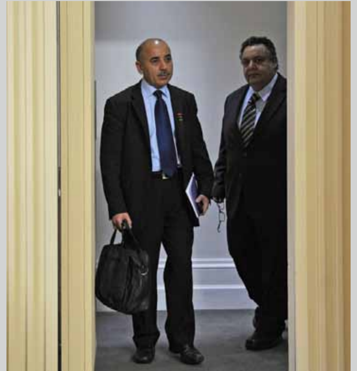
Consejo Nacional de transición libio solicita la intervención militar.

Organizaciones trotskistas (UIT-CI) están levantando la consigna "armas para los rebeldes libios" sin hacer una distinción correcta de la situación concreta, esto se expresa en que están perdiendo de vista el carácter pro-imperialista del Consejo Nacional de Transición libio (CNTL) que apoya a la intervención y bombardeos aéreos; es más, está convirtiendo a los rebeldes en peones de la intervención imperialista, en "infantería de la OTAN". Hay que precisar, que el CNTL está dirigido por exgadafistas y burgueses exiliados, que están tratando de disciplinar la insurrección detrás de un programa pro-imperialista y poniéndose al frente del proceso para desmontar todas las estructuras más o menos independientes de masas (comités y milicias), las mismas que no se ha podido materializar por la debilidad o inexistencia de una fuerza política obrera revolucionaria. Las organizaciones que conforman el CNTL en