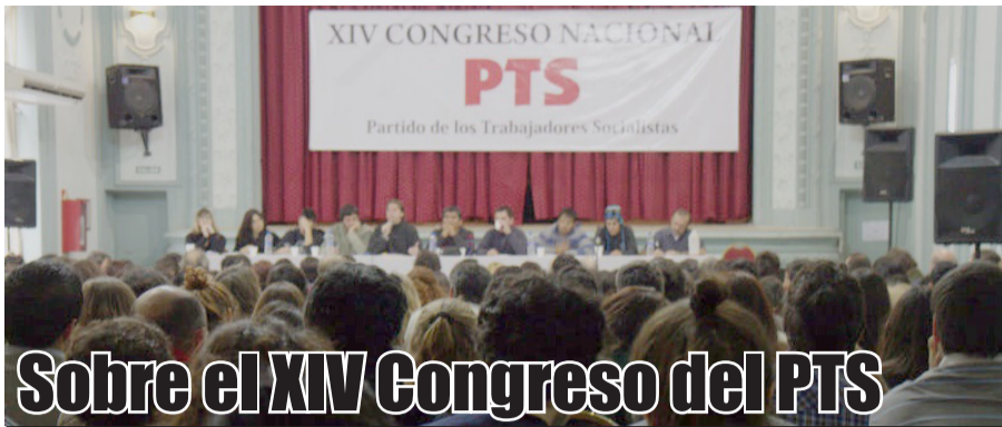
Sobre el XIV Congreso del PTS