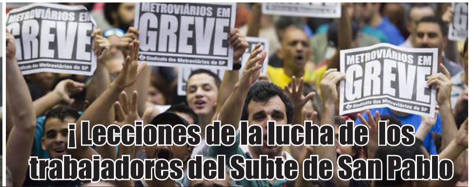
¡Lecciones de la lucha de los trabajadores del Subte de San Pablo