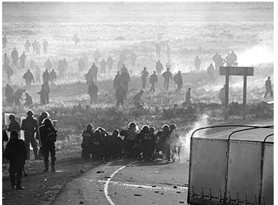
Represión policial en Caihuasi. El gobierno mostró "mano dura" contra los trabajadores para complacer a los empresarios.