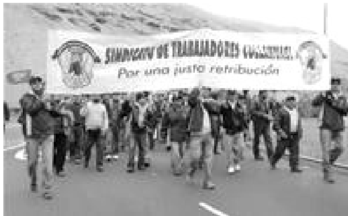
Marcha de los mineros de Collahuasi, cerca de Iquique

está en que fortalece no sólo su lucha, sino la de todos los trabajadores de Chile, porque hay trabajadores contratistas en todas las ramas de la economía y en muchas empresas, tratados injustamente como trabajadores de segunda, con menos salarios y menos derechos.